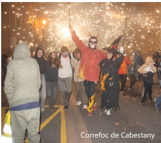
Correfoc de Cabestany