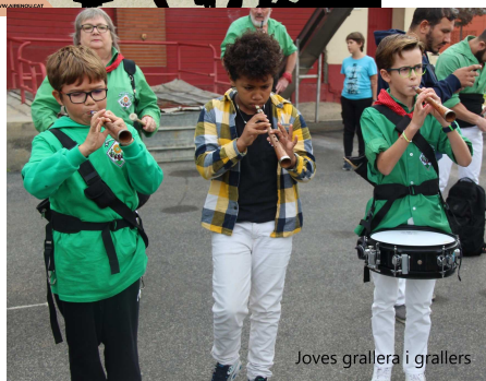
Joves grallera i grallers