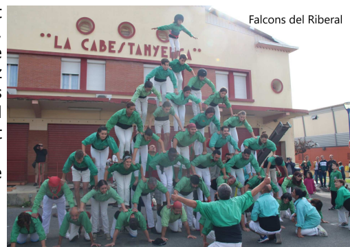
Falcons del Riberal