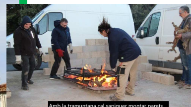
Amb la tramuntana cal sapiquer montar parets