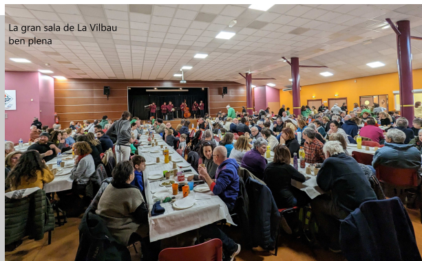
La gran sala de La Vilbau ben plena

Aire Nou de Bao una entitat al servei de la llengua catalana