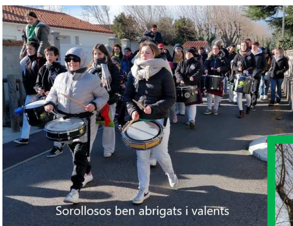
Sorollosos ben abrigats i valents

2023 és també l'any d'un nou equip tècnic que haurà de confirmar el nivell dels Castellers del Riberal. I 2023, podeu venir i participar a les activitats de l'Associació : El dimarts a partir de 19H.