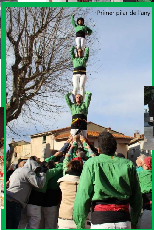
Primer pilar de l'any