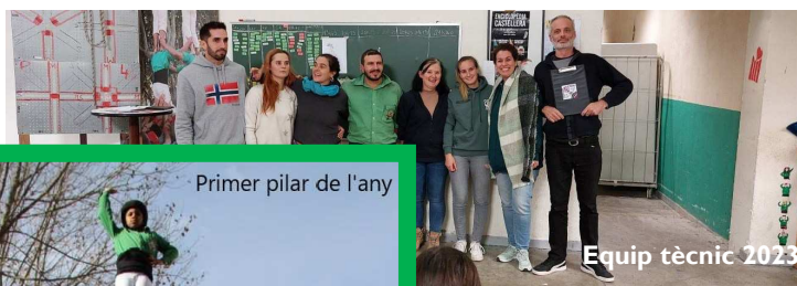
Equip tècnic 2023