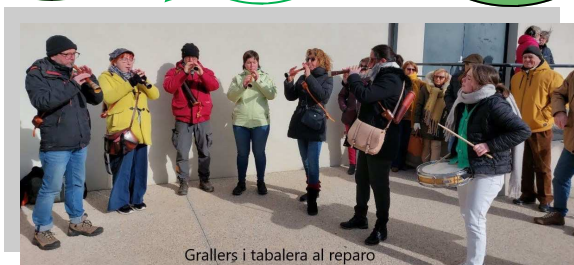
Grallers i tabalera al reparo