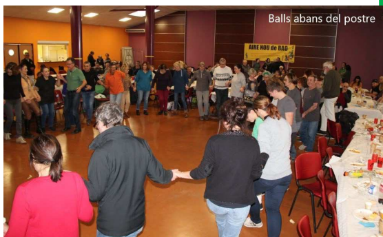
Balls abans del postre