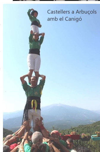
Castellers a Arbuçols amb el Canigó