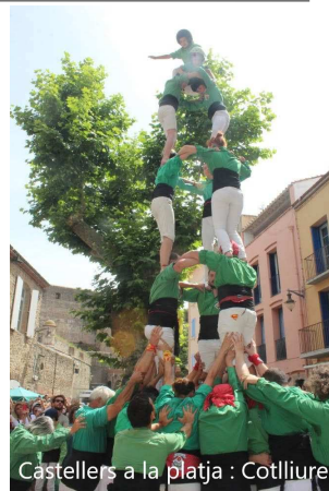
Castellers a la platja : Cotlliure