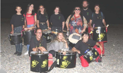
Sorollosos a cotlliure

Arribem a l'estiu i amb ell moltes sol·licitacions per Aire Nou de Bao i totes les seves activitats.