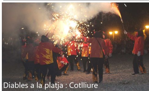
Diablers a la platja : Cotlliure