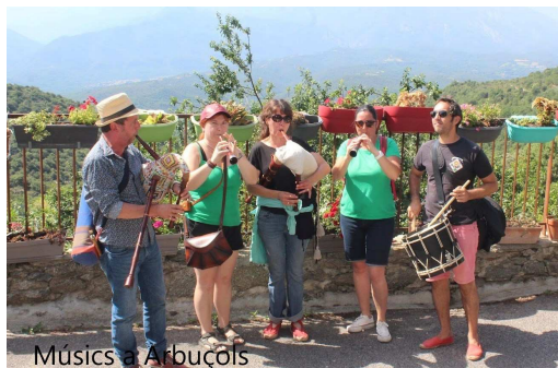
Músics a Arbuçols