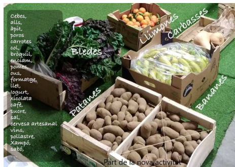
Part de la nova activitat