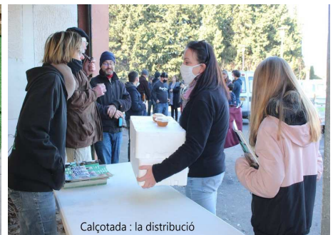
Calçotada : la distribució