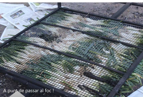
A punt de passar al foc !

El dimarts a partir de 18H30 teniu Ball de Bastons, Gralles i Castells. El divendres a 18H30 són els Sorollosos que comencen i els Casteller agafen el relleu a 20H . No dubteu petits i grans hi ha lloc per a tothom can Aire Nou. airenou@airenou.cat www.airenou.cat