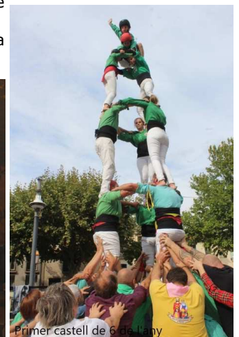
Primer castell de 6 de l'any