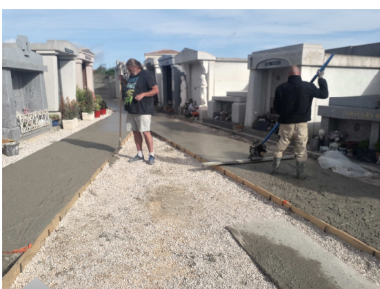
Aménagement des allées au cimetière