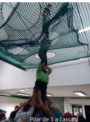
Pilar de 5 a l'assaig

Abans d'acabar la paraula ha estat donada als « oficials » que subratllen el treball fet per l'Associació baotenca i que donaran suport i ajudaran Aire Nou. I també la llengua i la cultura catalanes.