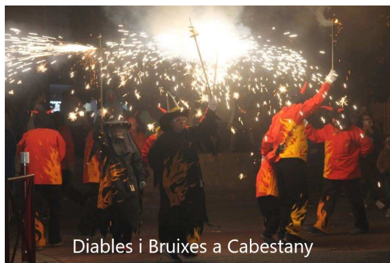
Diablers i Bruixes a Cabestany