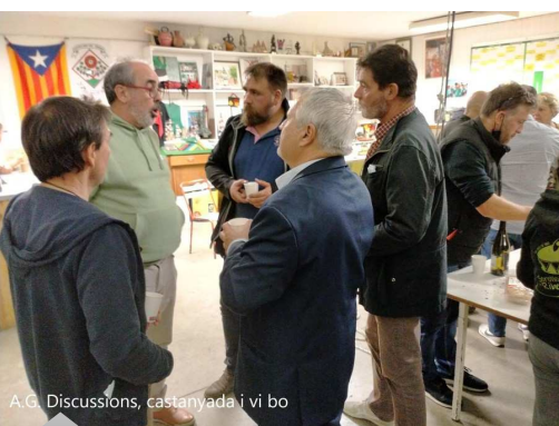
A.G. Discussions, castanyada i vi bo

Cal afegir que els Castellers del Riberal han tornat a fer castells de 6 i sobretot el pilar de 5 a l'assaig. Recordem que les portes són obertes per tothom.