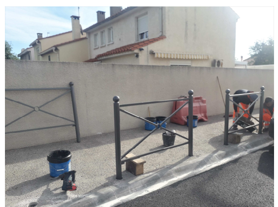
Mise en place des barrières de sécurité rue des écoles