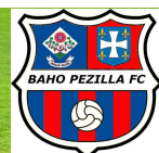
Photos et infos du club sur Facebook Baho Pézilla Football Club