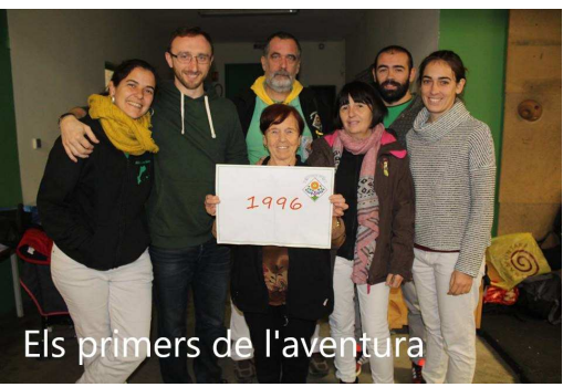
Els primers de l'aventura