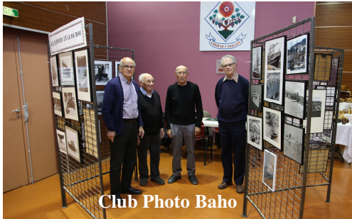
Club Photo Baho