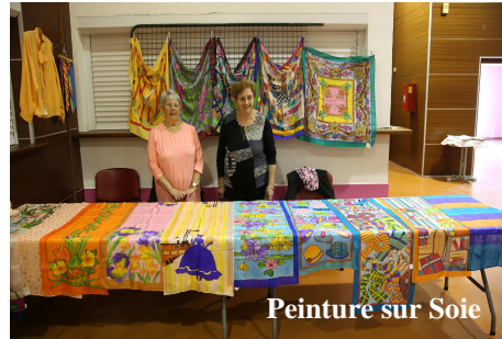
Peinture sur Soie