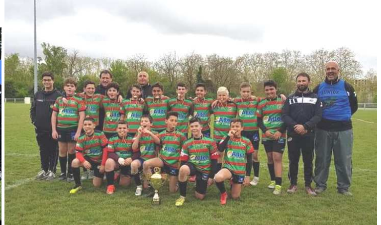
ACADEMIE DES GECKOS CATALANS BAHU XIII