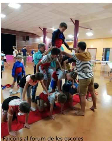
Falcons al forum de les escoles