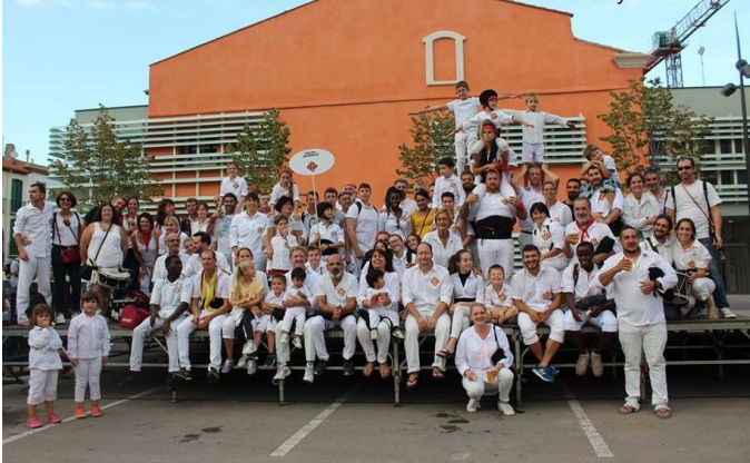
Falcons del Riberal Trobada Nacional de Falcons de Catalunya 2019