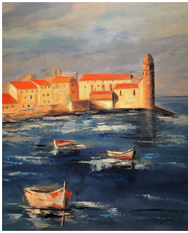
A.MANAS Huile sur carton Toilée 33x41 'Colloure', source éternelle d'inspiration

Aucune manifestation n'est possible pour l'instant, ne pouvant toujours pas disposer de salle municipale. Cependant le bureau reste actif et à l'écoute de ses adhérents par mail ou boîtage. Aujourd'hui dans ce bulletin nous vous proposons un premier dossier sur l'Atelier Peinture : Voici 2 artistes locaux.